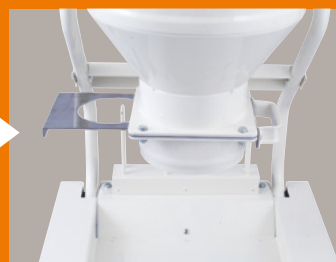
仕切板を戻して袋を外す