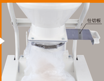
仕切板を引いてゴミを回収